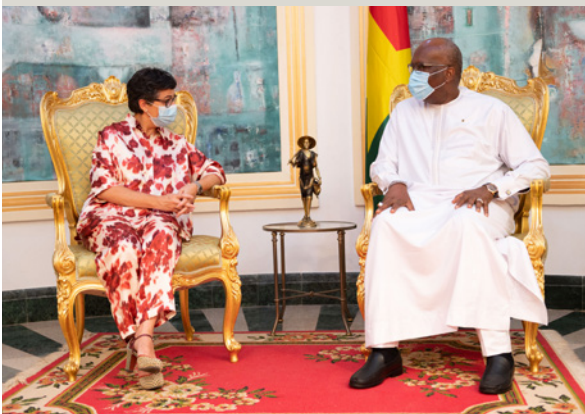
La Ministra de Asuntos Exteriores, Unión Europea y Cooperación, con el Presidente de Burkina Faso.

Sin paz y seguridad, ningún esfuerzo puede fructificar. Los esfuerzos para el desarrollo sólo pueden ser eficaces en un entorno seguro. Seguridad y desarrollo son un binomio insoluble que debe ser reforzado con las acciones humanitarias. Algunas medidas destacadas: i) reforzar el nexo paz, seguridad y desarrollo en el Sahel, y la presencia del Estado en zonas frágiles; ii) desarrollo de las capacidades militares en países de la costa occidental de África y el Golfo de Guinea; iii) refuerzo de la participación española en las acciones de la UE en el Sahel, en particular, a través de la dirección de proyectos como los Grupos de Acción Rápida en el Sahel, que fortalecen los vínculos entre las fuerzas y cuerpos de seguridad y la población civil, y de Equipos Conjuntos de Investigación en la lucha contra el terrorismo y el tráfico de personas; iv) apoyo a las capacidades de mediación de actores africanos y a iniciativas africanas concretas de mediación ante situaciones de conflicto; v) y el apoyo a estrategias de prevención y de lucha contra la radicalización.