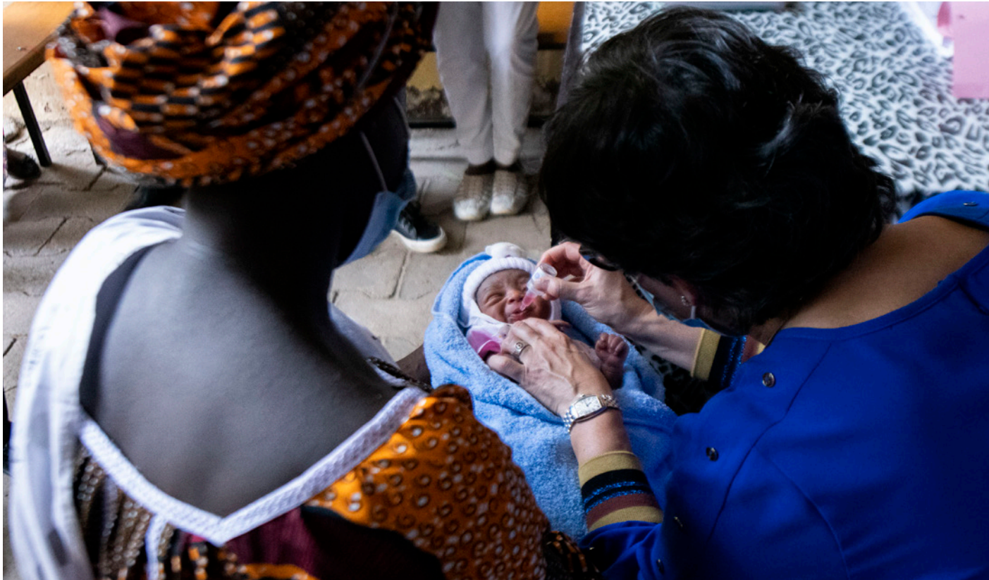
La Ministra de Asuntos Exteriores, Unión Europea y Cooperación, durante su visita a un hospital en Yamena (Chad) en febrero de 2021.