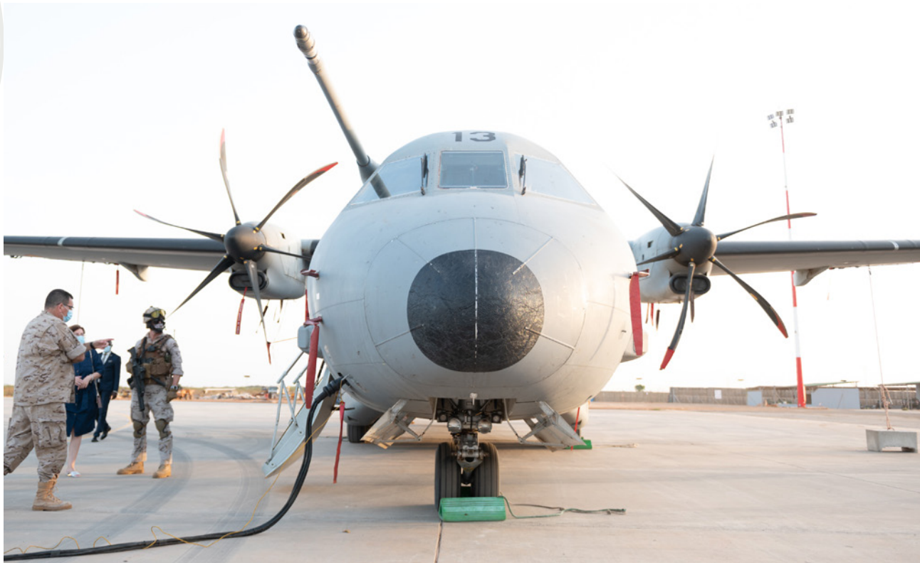
Avión de transporte del Ejército del Aire español desplegado Dakar dentro del Destacamento 'Marfil'.

en Marruecos, en su mayoría pequeñas y medianas, con un conocimiento de África considerable, permite además pensar en una vinculación entre ambos países piloto para intentar explotar el potencial de triangulación España-Marruecos-Senegal, realizando actividades orientadas a ese fin.