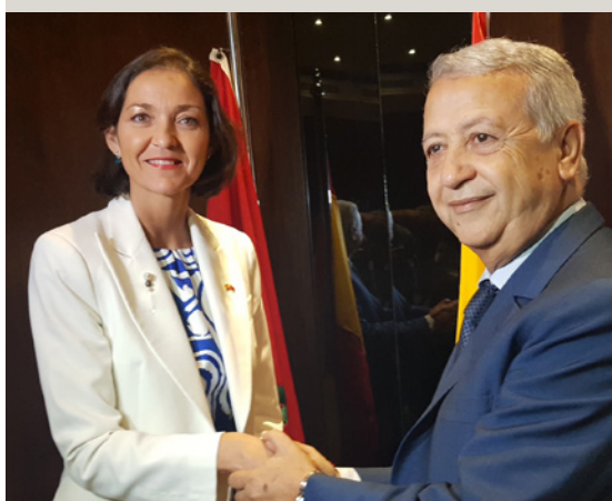
La Ministra de Industria, Comercio y Turismo de España, Reyes Maroto, durante una reunión con el Ministro de Turismo de Marruecos.

Es objeto de atención estratégica dentro del Foco África 2023. Los sectores prioritarios identificados son: el agroalimentario, en particular, el desarrollo agroindustrial; el del agua y saneamiento y de tratamiento de residuos; el de ingeniería y consultoría; el energético, con especial énfasis en energías renovables; el de las infraestructuras de transporte; el químico y farmacéutico; y el de la transformación digital. Se actuará con i) medidas concretas para potenciar los mecanismos financieros de apoyo a la inversión de empresas españolas en África, incluyendo el apalancamiento de fuentes de financiación multilaterales, de la UE y del Banco Europeo de Inversiones; y ii) apoyo institucional a los operadores económicos españoles; iii) movilización del sector privado.