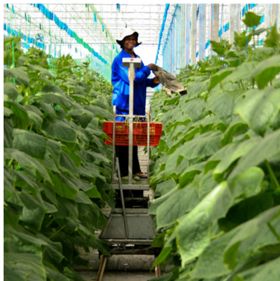
Mujer trabajando en una explotación agrícola de África Subsahariana.