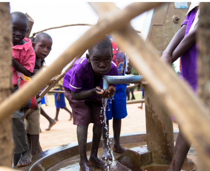
Un grupo de niños junto a la fuente de una escuela en la ciudad de Soroti, Uganda.

Director de la Cooperación Española y en colaboración con la Unión Africana y, en particular, su Centro de Control de Enfermedades (CDC), y las ONG. La Cooperación Española ha establecido como la máxima prioridad de sus actuaciones en respuesta al COVID-19 el refuerzo de los sistemas de salud, atendiendo a la prevención para afrontar y prevenir pandemias y nuevas oleadas de las mismas, sin descuidar la atención a otras enfermedades de gran prevalencia e impacto en las poblaciones africanas.