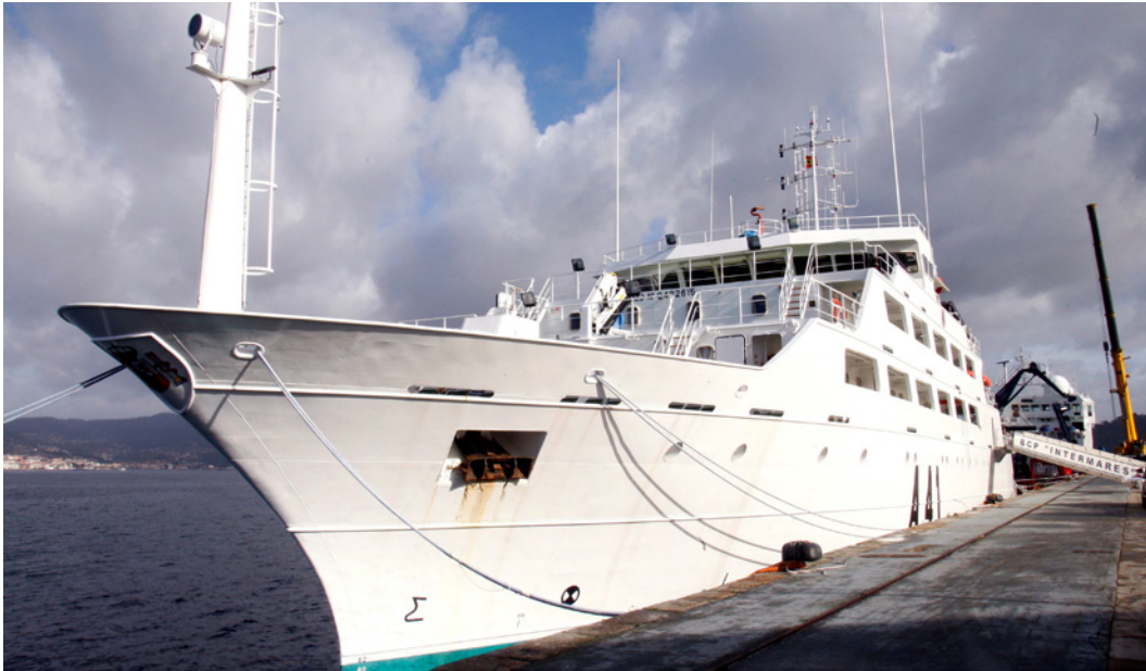
Buque Escuela de cooperación pesquera "Intermares".

ña está poniendo en valor su compromiso con la región a través de la Presidencia de la Asamblea General de la Alianza Sahel. Se impulsará la resiliencia socioeconómica ante el COVID-19, la seguridad alimentaria, el cambio climático, la agenda Mujeres, Paz y Seguridad y la igualdad de género.