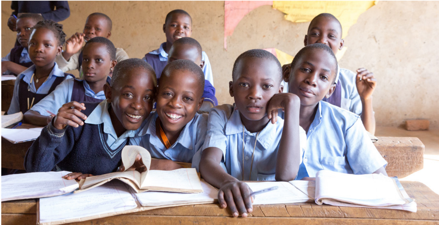
Un grupo de escolares en Uganda.