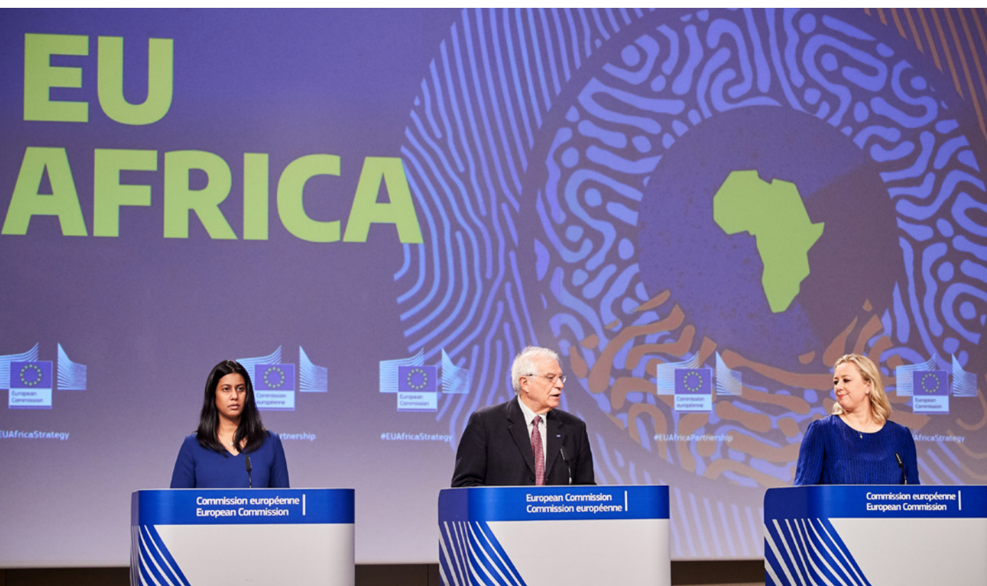
El Alto representante de la Unión Europea para Asuntos Exteriores y Política de Seguridad, Josep Borrell, junto a la Comisaria para las Asociaciones Internacionales, Jutta Urpilainen, durante la rueda de prensa de presentación de la nueva estrategia UE-África, el 9 de marzo de 2020.

de la Cooperación Española en el continente; 4) la solidaridad de la sociedad civil española; 5) una cultura y una lengua universales; 6) el compromiso con la paz y la seguridad de nuestras Fuerzas Armadas y Fuerzas y Cuerpos de Seguridad; y 7) su posición geográfica de país bicontinental, con más de dos millones de ciudadanos residentes en Canarias, Ceuta y Melilla.