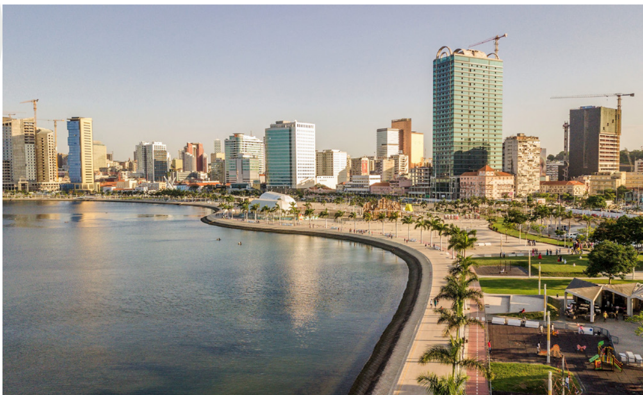
Vista de la bahía de Luanda, capital de Angola.

A los efectos del seguimiento y evaluación de este programa se diseñará un mecanismo que incluya indicadores de seguimiento.