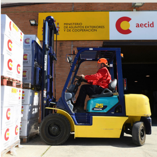
Almacén de ayuda humanitaria de la AECID en la Base Aérea de Torrejón de Ardoz.

Algunas medidas destacadas: i) Se concentrará en seguridad alimentaria y nutrición, protección y educación en emergencias, favoreciendo la coordinación y complementariedad entre actores humanitarios y de desarrollo; ii) en el contexto de emergencias, la respuesta podrá ser multidimensional, incluyendo agua, saneamiento e higiene; iii) se hará hincapié en la protección de las mujeres y niñas en situaciones de conflicto, con una especial atención a su mayor vulnerabilidad ante la violencia sexual; y también, iv) liderar la iniciativa Escuelas Seguras, en contextos de conflictos armados.