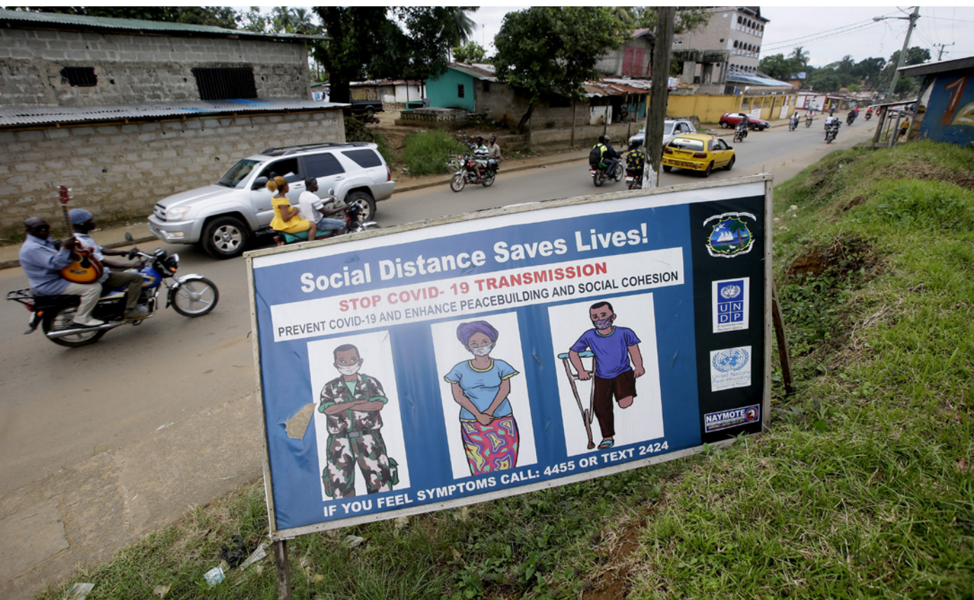
Campaña de lucha contra el COVID-19 en una calle de Monrovia (Liberia) en diciembre de 2020.

recesión en la crisis de 2009, en 2020 son 41, el mayor número en 30 años. Se prevé una reducción de la renta per cápita del 6,7% y un incremento de la población en situación de extrema pobreza en una cifra de entre 40 y 60 millones de personas. Por su parte, la Unión Africana (UA) estima que más de 80 millones de empleos, tanto formales como informales, se podrían destruir en el continente a causa de la pandemia, agravando la falta de oportunidades de los jóvenes africanos. Por otro lado, la crisis económica está incrementando las desigualdades, incluida la de género, lo que podrá erosionar la confianza de la ciudadanía en los gobiernos y el contrato social.