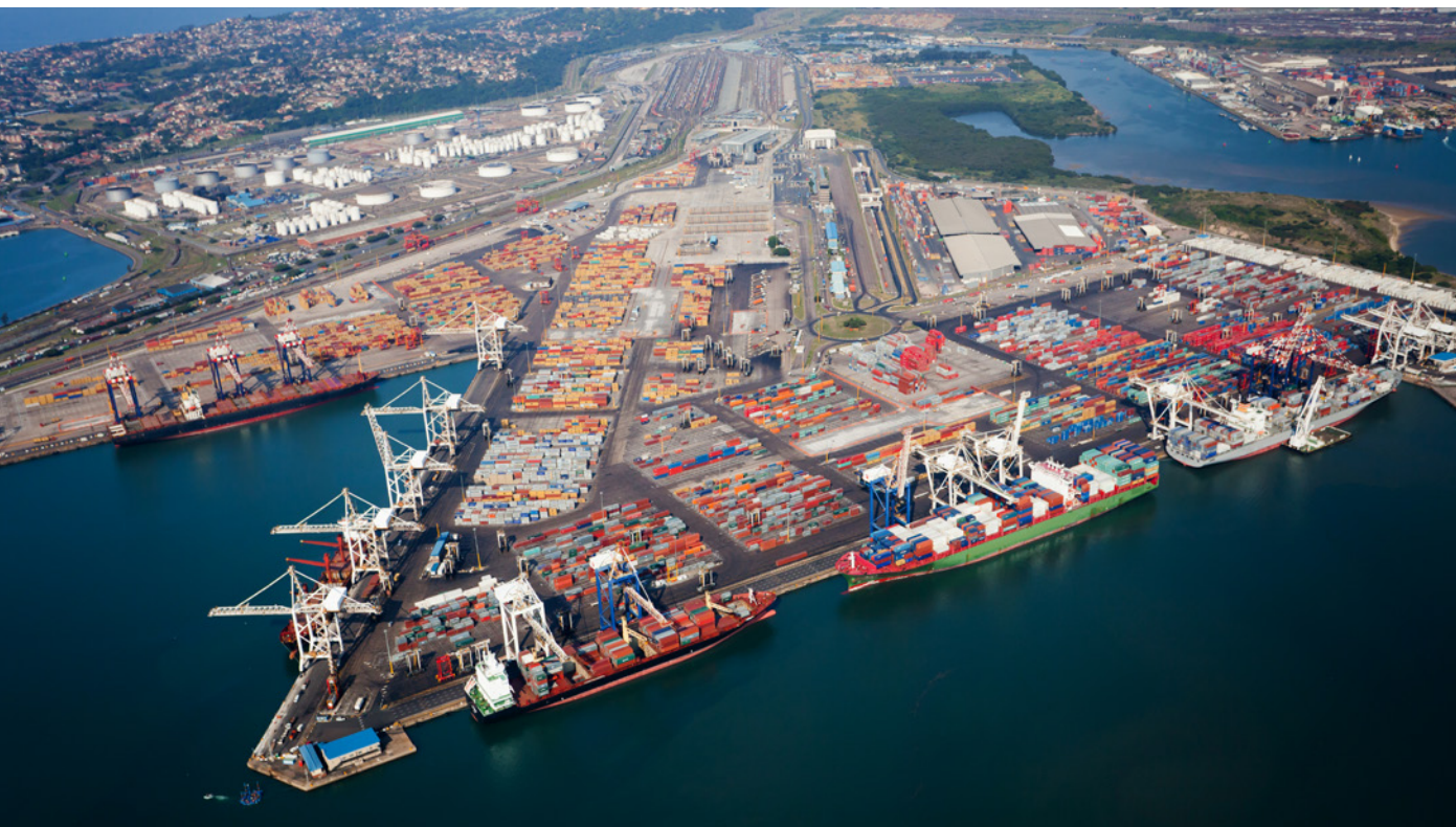
Vista aérea del puerto de Durban (Sudáfrica)

Medidas para reforzar el papel de la Compañía Española de Seguros de Crédito a la Exportación (CESCE):