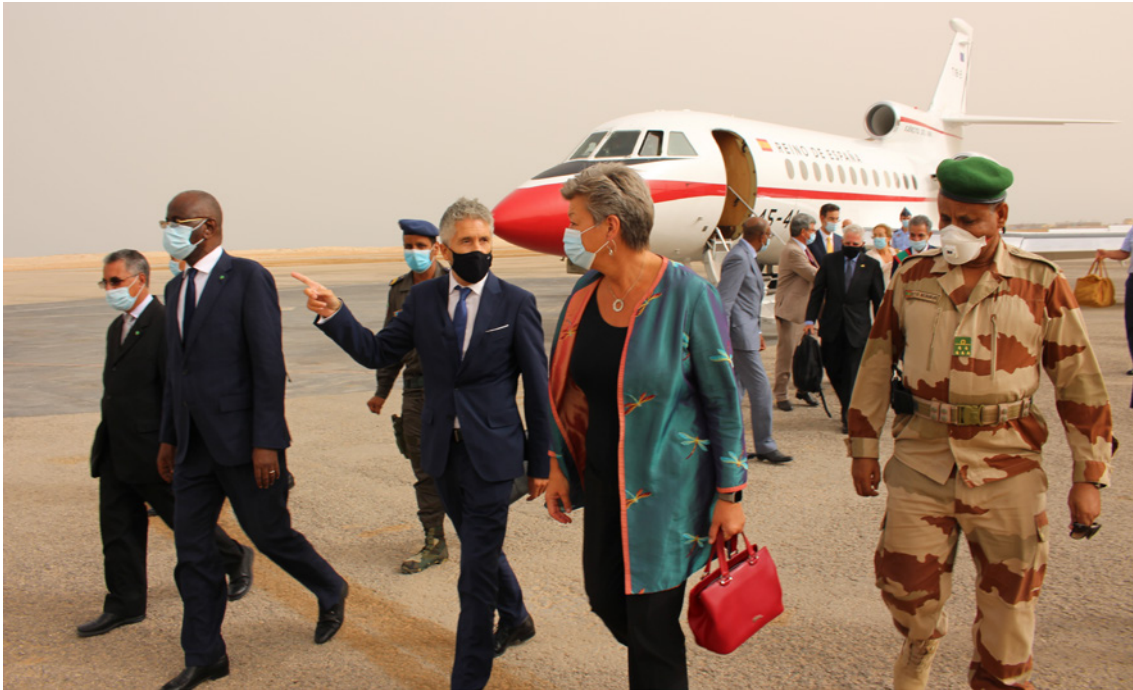
El ministro del Interior, Fernando Grande-Marlaska, junto a la Comisaria Europea de Interior, Ylva Johansson.

Además de potenciar la migración ordenada, es importante acordar bilateralmente un régimen de seguridad social que atienda y beneficie a los trabajadores que hayan cotizado, y proteger a los refugiados