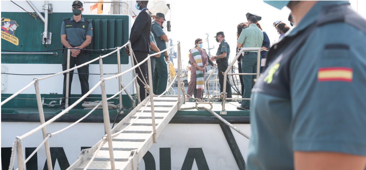
La ministra de Asuntos Exteriores, Unión Europea y Cooperación, Arancha González, conversa con miembros del destacamento de la Guardia Civil desplegado en Dakar (Senegal) durante su visita en noviembre de 2020.

Ghana, Kenia y Tanzania, se suman Ruanda y Uganda, por su gran dinamismo económico; y Marruecos, Argelia y Egipto, de gran interés para la empresa española.