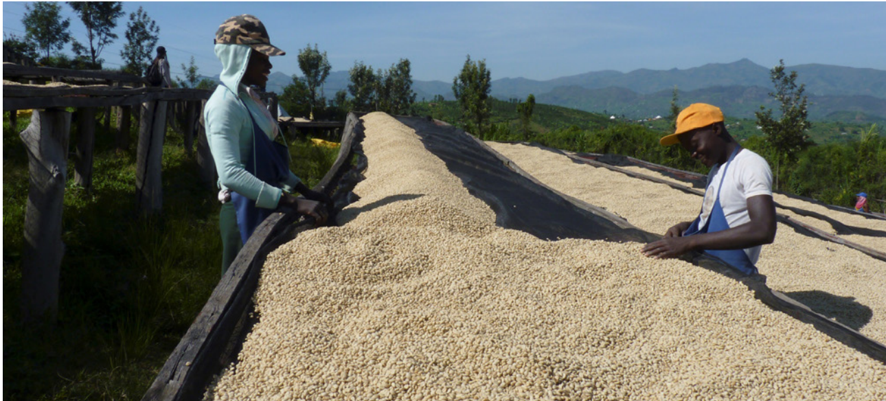
Dos empleados de la cooperativa Kopakama en Ruanda, procesando granos de café.