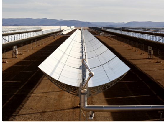
Placas solares de la megaplanta solar de Uarzate, en el sur de Marruecos, construida por un consorcio español.