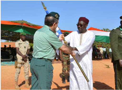
El General Espinosa entrega al Presidente de la República de Níger el banderín de la compañía de Gendarmería entrenada en el marco del programa GAR-SI.