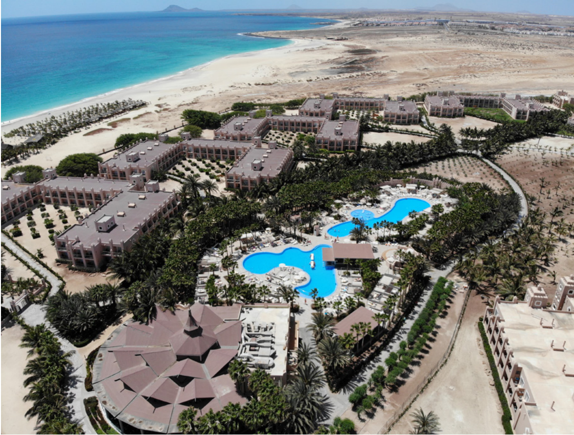
Complejo turístico de una compañía española en la Isla de Sal, Cabo Verde.