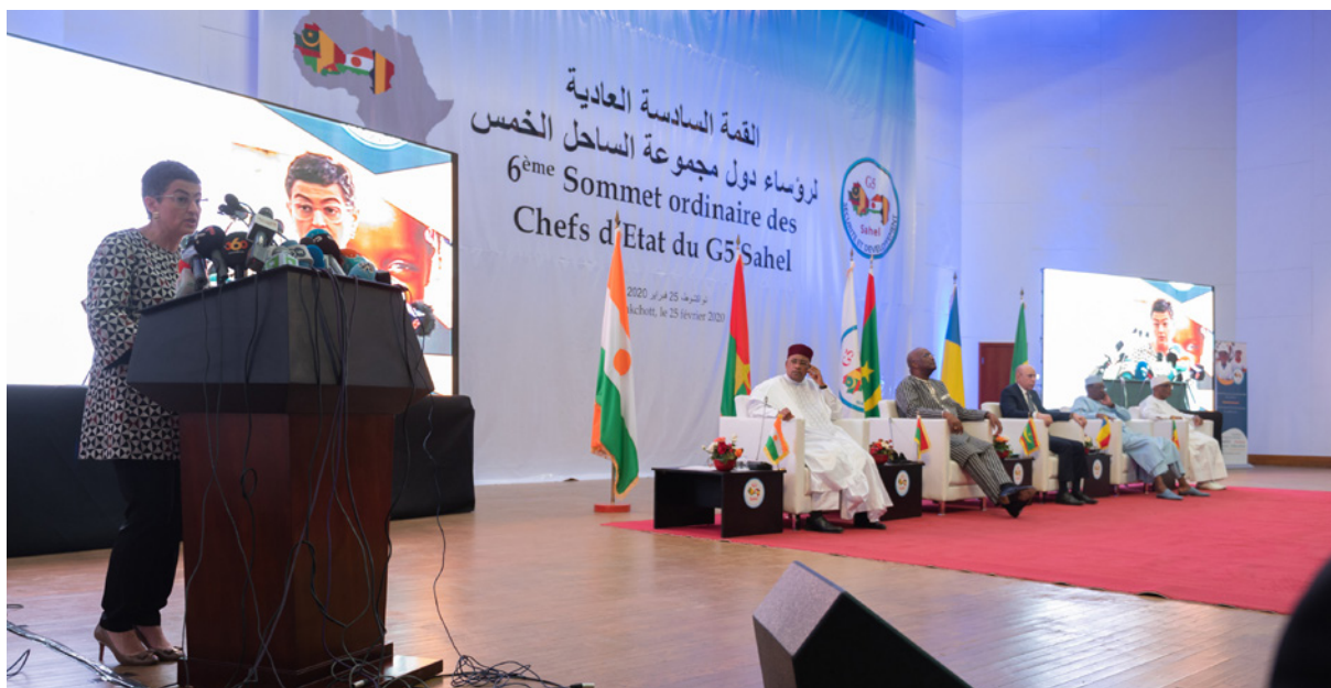
La ministra de Asuntos Exteriores, Unión Europea y Cooperación, en la Cumbre de Jefes de Estado del G5-Sahel, celebrada en Mauritania, en febrero de 2020.