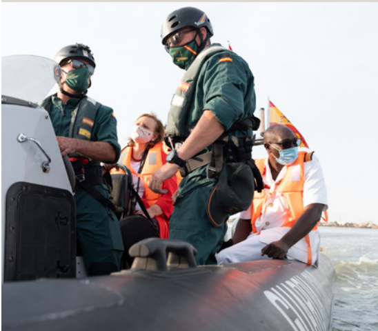
La Secretaria de Estado, Cristina Gallach, durante su visita al destacamento de la Guardia Civil en Gambia, realizada en diciembre de 2020.

Algunas medidas destacadas: i) contribuir a mejorar las capacidades de los países de origen y de tránsito para el control de sus fronteras y la gestión migratoria; ii) la prevención de la trata y la lucha contra las redes criminales que trafican con seres humanos y en particular con mujeres y niñas; iii) impulsar mecanismos de materia de migración regular; iv) fomentar la participación en el Programa ERASMUS+ y otros que impulsan la movilidad en el ámbito de la Educación Superior; v) contribuir a la protección de refugiados.