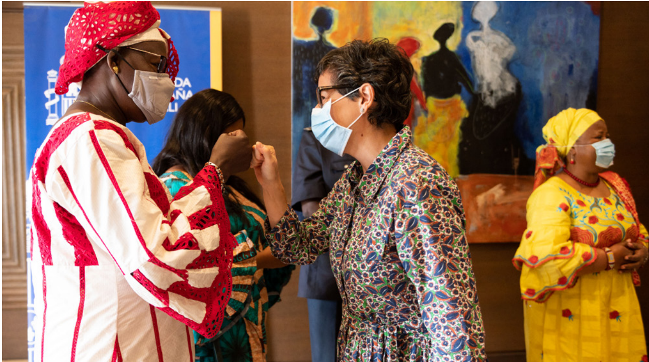
La Ministra de Asuntos Exteriores, Unión Europea y Cooperación, Arancha González, durante un encuentro con mujeres líderes en Bamako, durante su visita a Mali en octubre de 2020.

Por otro lado, la Estrategia de Acción Humanitaria (EAH) 2019-2026 considera una prioridad la prevención y respuesta a la violencia de género en las crisis humanitarias, y reconoce que la igualdad de género es condición sine qua non para abordar y reducir la violencia de género.