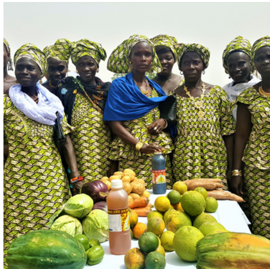
Cooperativa de mujeres en Casamance, Senegal.