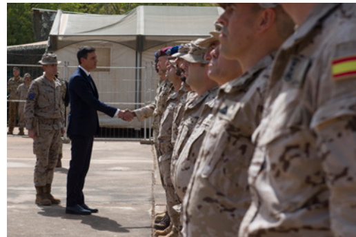
El Presidente del Gobierno, Pedro Sánchez, durante su visita en diciembre de 2018 al contingente militar español desplegado en Mali.

Se subsume en la Estrategia de Acción Exterior 2021-2024 y, conforme al principio de unidad de acción en el exterior, traduce la acción exterior de todos los actores institucionales del Gobierno de España en África, y otros actores españoles en el continente. Asimismo, se alinea con los Objetivos de Desarrollo Sosteni-