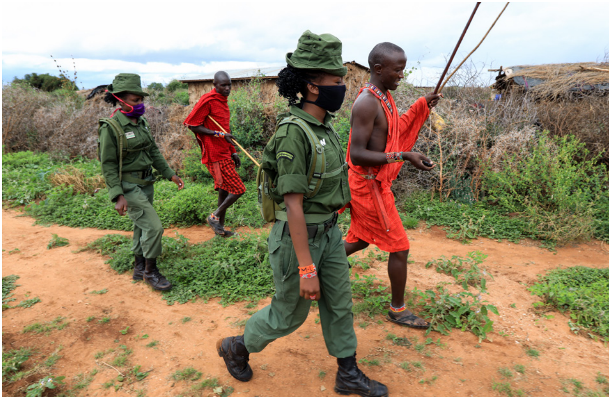
Empleadas del servicio de guardabosques de Kenia hablan junto a miembros de la comunidad masi, en Amboseli (Kenia), durante una patrulla en mayo de 2020.