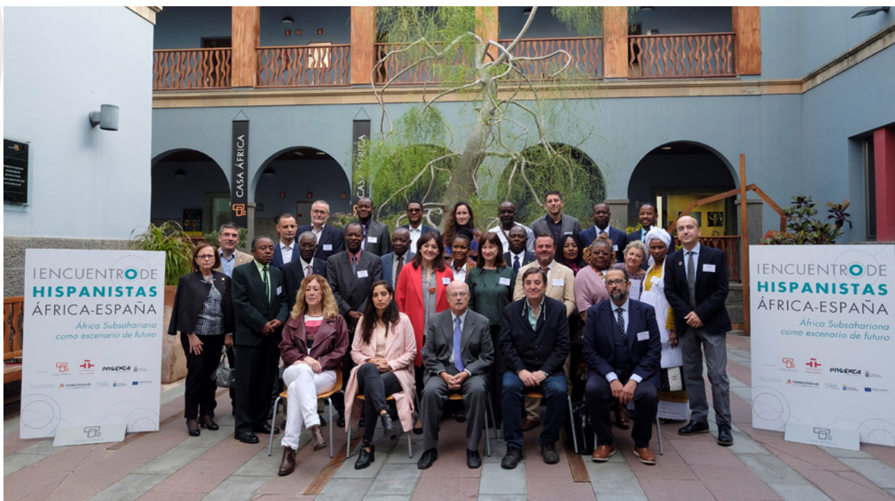
Foto de familia del I Encuentro de Hispanistas celebrado en Casa África en noviembre 2019, con la presencia del director del Instituto Cervantes, Luis García Montero, entre otras personalidades.

Casa África. Tiene cinco campos de actuación fundamentales: diplomacia pública, económica, cultural, digital y en el ámbito institucional.